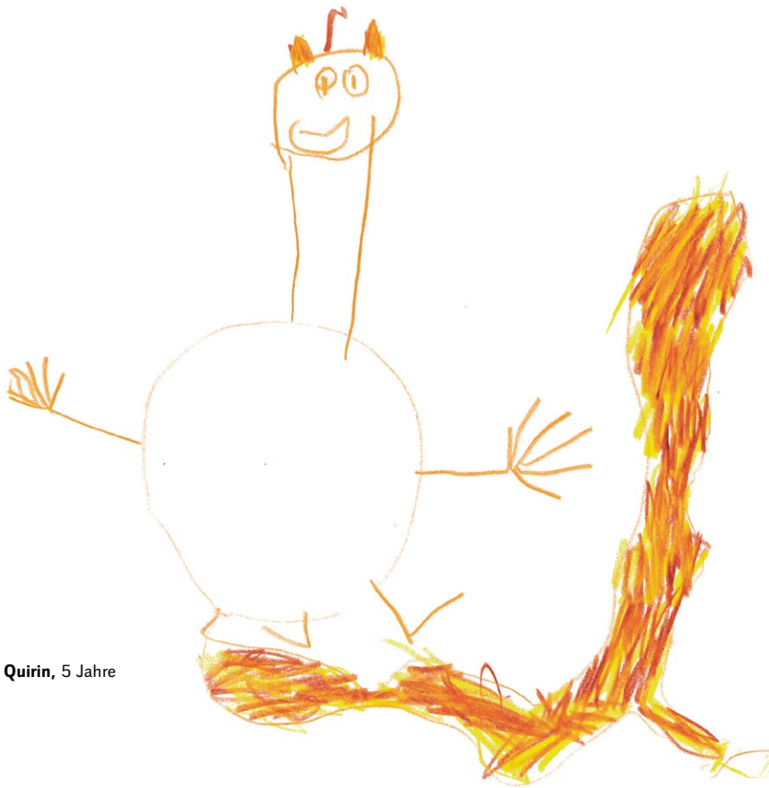
Quirin, 5 Jahre