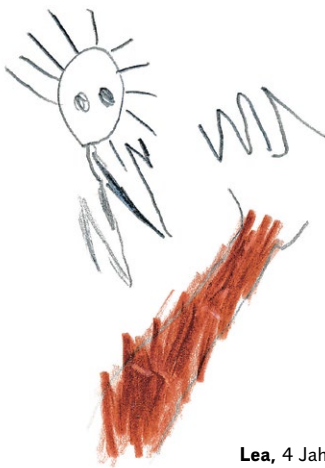
Lea, 4 Jahre

Fortpflanzung: Nach der Paarungszeit im Winter (Januar–Februar) bringt das Weibchen nach etwa fünf Wochen in einem kugeligen Nest (Kobel) hoch in einer Baumkrone ein bis sechs Junge zur Welt. Die zunächst nackten und blinden Jungtiere werden etwa zwei Monate lang gesäugt, verlassen aber schon nach sechs Wochen das erste Mal das Nest und beginnen mit der Nahrungssuche. Oft eine zweite Paarungszeit im späten Frühjahr.